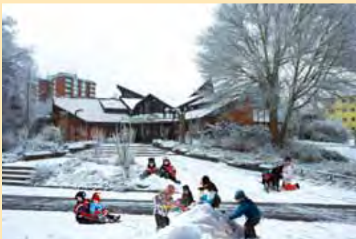
Titelbild: Winterstimmung vor dem Nachbarschaftshaus