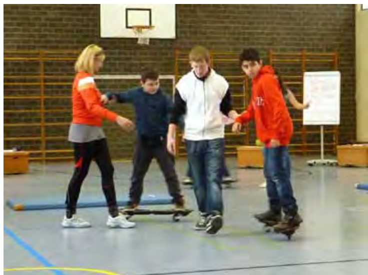
Trendsportart Waveboard als Bestandteil der neuen Fitnessklasse an der Tümpelgarten-Schule

Die Aufmerksamkeit der Grundschul Kinder richtete sich am Präsentationstag jedoch weniger auf die verschiedenen Schulformen und deren Abschlüsse, als vielmehr auf die attraktiven Sportangebote der neuen Fitness-Klasse. In dieser Klasse sollen ab dem